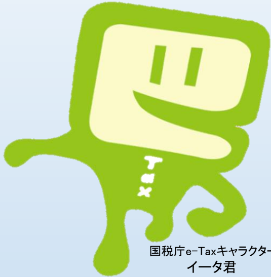
国税庁e-Taxキャラクター イータ君