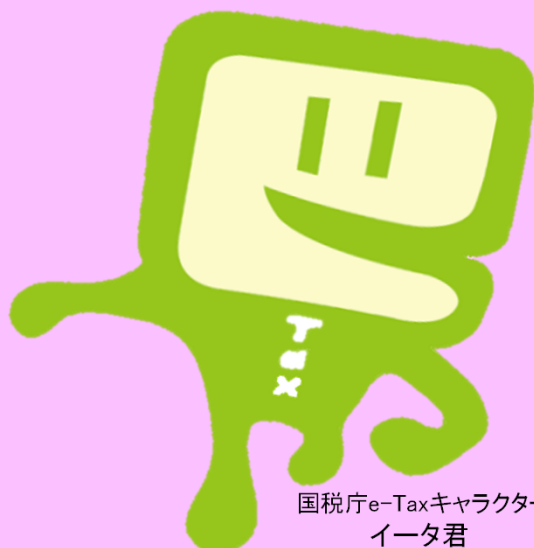
国税庁e-Taxキャラクター イータ君