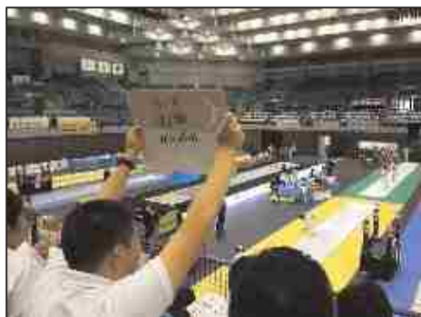
観戦のイメージ（国際大会観戦の様子）

次世代を担う子どもたちが、オリンピック・パラリンピックの競技観戦を通じ、国際感覚やスポーツの楽しさなどを身につけられるよう、県内の児童生徒に対して、本県開催競技を中心に大会を直接観戦する機会を提供します。