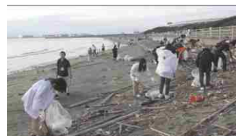
幕張の浜 清掃活動

県内事業者等が主体的に実施する「おもてなし活動」に参加し、オール千葉おもてなし隊のPRを通じて、おもてなしの輪を広げます。