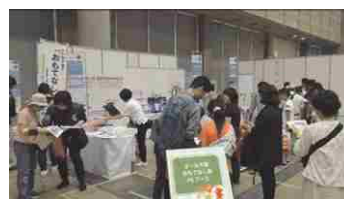
県民の日中央行事

多くの県民が集まる機会を捉えてイベントを開催し、おもてなしについて考え、行動するきっかけづくりを行います。