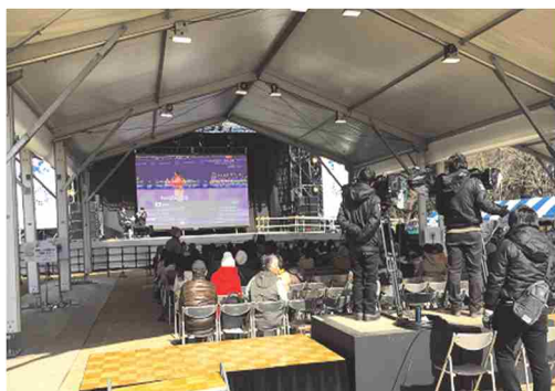
ライブサイトのイメージ

県と組織委員会との共催 により、観戦チケットを持たない人でも、競技会場外で、大画面による迫力ある競技の生中継の観戦やオリンピック・パラリンピック競技の体験などを楽しむことができます。