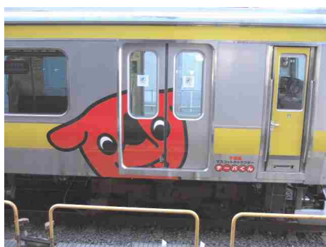
交通広告の活用例

東京オリンピック・パラリンピック観戦者や関係者の宿泊が数多く見込まれる、県内宿泊施設に本県観光PRパンフレットを配架します。