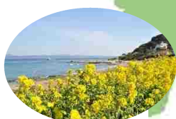
房総フラワーライン/館山市