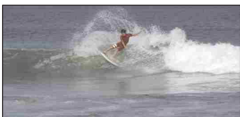
[東京2020大会に向けたプロモーション動画]