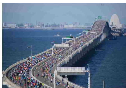
ちばアクアラインマラソンランナー(前回大会)