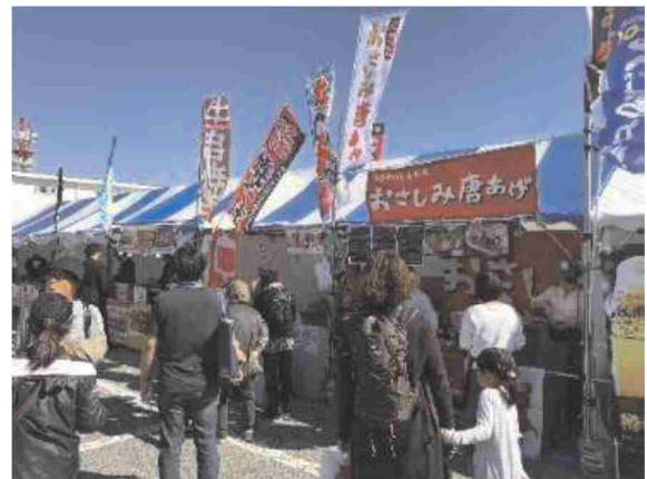
イベント会場での観光物産展の様子

担当課・問い合わせ先 商工労働部観光企画課 043-223-2419 農林水産部流通販売課 043-223-2959