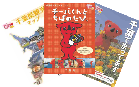
配架するパンフレットの例