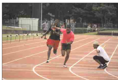
米国陸上チームの事前キャンプ(H27)