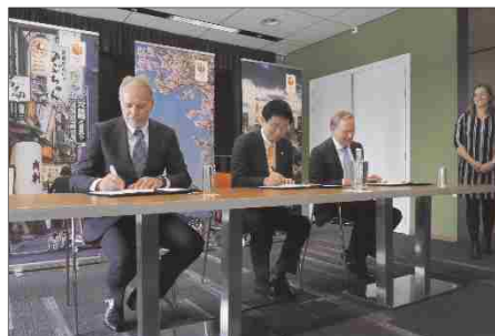
オランダオリンピック委員会との協定締結式