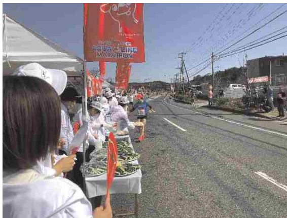
沿道での物産PRの様子

ランナーに県産農産物や飲料を配布するほか、プレイベント等で県産農林水産物のPRを実施します。