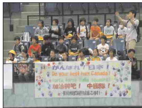
観戦のイメージ（国際大会観戦の様子）