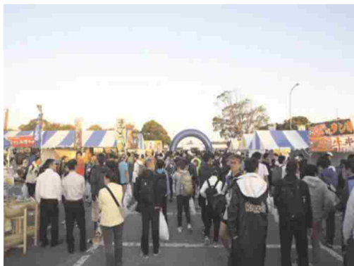
PR イベントのイメージ

県主催 により、ライブサイト会場の隣接地において、市町村や経済団体等と連携し、県内各地の観光情報の提供や特産品の販売などを通して、効果的に県の魅力を発信します。