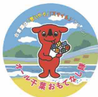
オール千葉おもてなし隊 缶バッジ