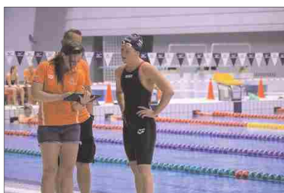
オランダ水泳チームの事前キャンプ(R1)

県施設を使用するオランダ各競技チーム及び成田・佐倉・印西3市とともに誘致を進める米国陸上チームの事前キャンプを受け入れます。