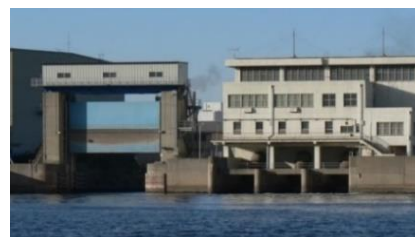
水門・排水機場の改修整備