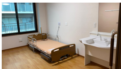
老人福祉施設整備

洋上風力発電の建設補助港・メンテナンスの拠点として利用するための防波堤や岸壁の整備等