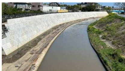
河道拡幅・護岸整備