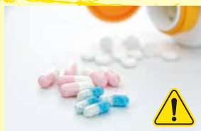
市販薬の過剰摂取