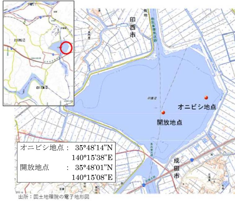
図 1. 調査地点