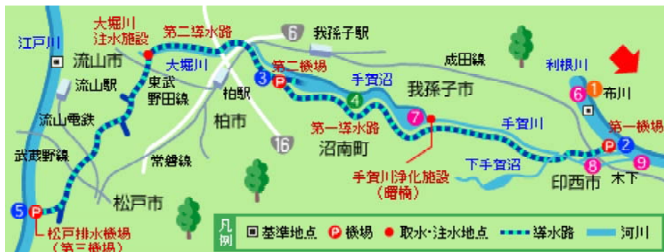
図1 手賀沼及び北千葉導水路の概略図

無機態の栄養塩、特に硝酸性窒素は、浄化用水である利根川の水の濃度もかなり高いこと、また、植物プランクトンの増殖が抑制されているため、取り込み量が減少していることにより、冬季を中心に過剰に存在しており、滞留時間が植物プランクトン増殖の制限因子になっている時が多いと考えられる。