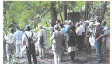
養老溪谷での地層の観察