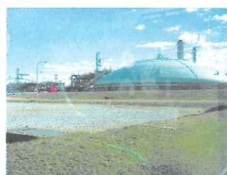
液化天然ガスタンク