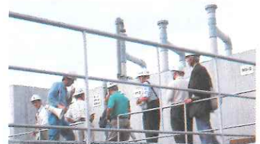
天然ガス井戸の見学