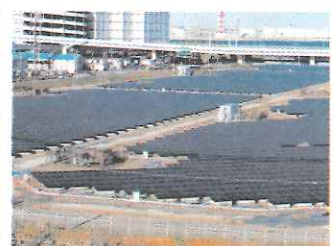
太陽光発電パネル