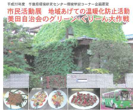
図3 美田自治会のグリーン・ぐりーん大作戦チラシ(部分) グリーンカーテンでおおわれた家・ゴーヤクッキングコンテスト・流山市コミュニティバス

センターでは、上記のように環境保全活動や環境学習に取り組んでいる団体の方々と協力して企画展を開催しています。協働での企画展開催をご希望の団体の方は学習施設（0436-24-5309）までご連絡ください。なお、全てのご要望に応えられない場合もあることをあらかじめご承知おき下さい。展示用パネルの作成は、皆様と協働で作成していきます。市民団体には、パネル作成に必要な情報の提供、展示作業、解説、広報等をお願いしています。（企画情報室 小川かほる）