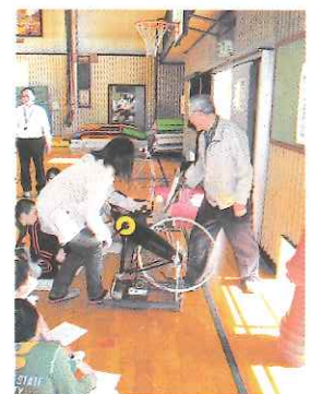
人力発電機による発電実験