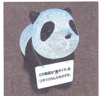
廃タイヤをリサイクルして作ったパンダの椅子(こちらも貸出しております。)