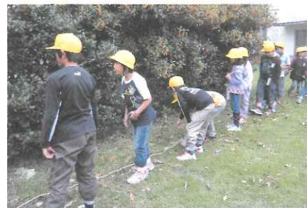
写真1 NPO法人千葉自然学校

自然発見ゲーム：自然の中に人工物が隠されています。その隠されたものをじっくり観察して、探すことで、観察力を養い、自然の中で動物たちがうまく身を隠す知恵を学びます。