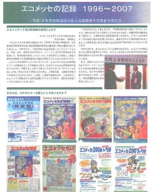
図2 エコメッセの記録パネル