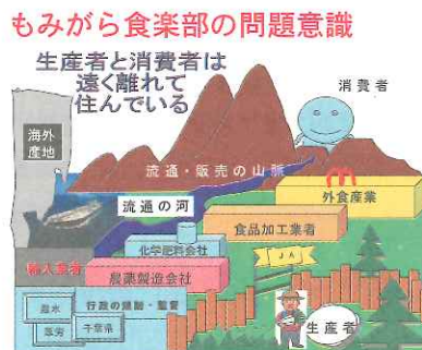
平成19年度エコマインド養成講座地域での活動プログラム発表会スライドから(2009年12月12日)

もみがら食楽部は平成19年度千葉県エコマインド養成講座の修了生5人が結成した活動団体です。もみがら食楽部では、“普通の”消費者と生産者の出会いを企画運営し、お互いの理解をすすめる、“食”を通じて環境への関心を広めるための体験学習会(=食ックツアー)を開いています。この活動を通じてメンバーの一人が無農薬の稲作栽培を始めるなど、農業に関連した環境保全の取組に発展しています。企画展では、体験学習会の様子を紹介しました。また、センターが開催した公開講座でも展示や発表を行っていただきました。(図1 もみがら食楽部の考え方)