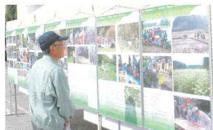
写真2 展示風景(市原市リサイクルフェア)