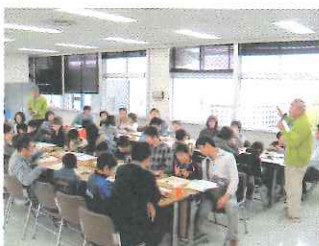
地球温暖化の説明の様子