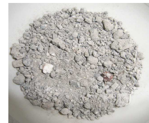
焼却灰(サイズ調整なし)