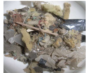
破碎物1(サイズ調整なし)