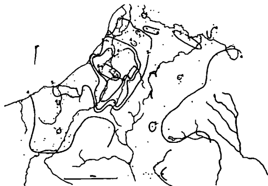
図2 中越地震本震の際の気象庁震度階の分布

を囲むように刈羽村の方へ北東方向へ、その分布の張り出しがみられる。また、東山背斜・八石山背斜軸に沿って北東方向へ張り出して分布している。