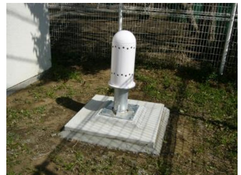
写真5-2 モニタリングポスト検出部