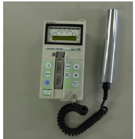
写真4-1 シンチレーションサーベイメータ