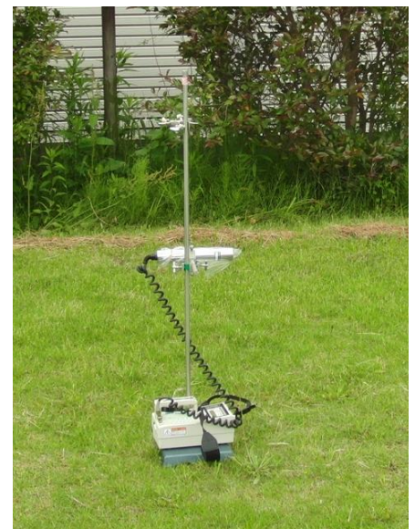
写真4-2 サーベイメータによる測定