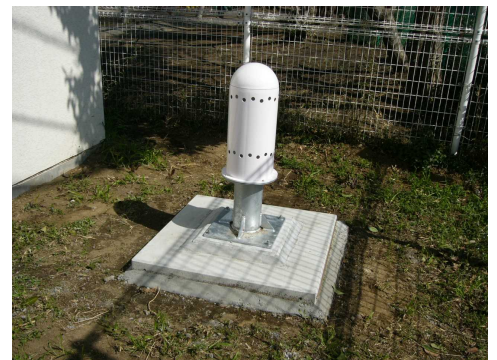
写真5-2 モニタリングポスト検出部