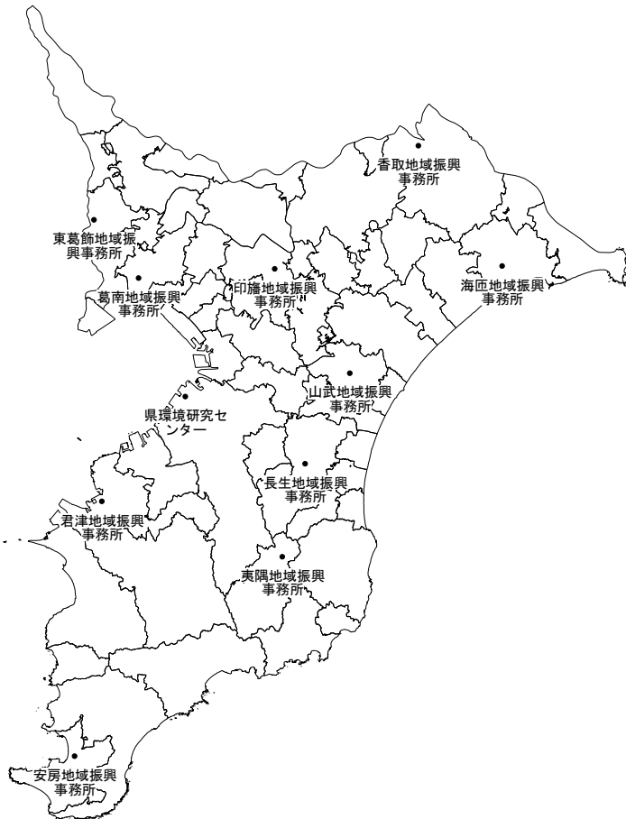
図4-1 サーベイメータによる調査地点図