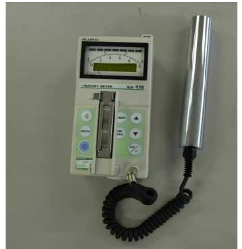
写真4-1 シンチレーションサーベイメータ