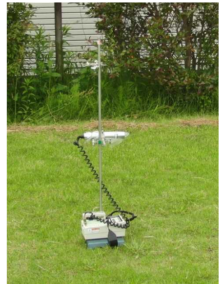
写真4-2 サーベイメータによる測定