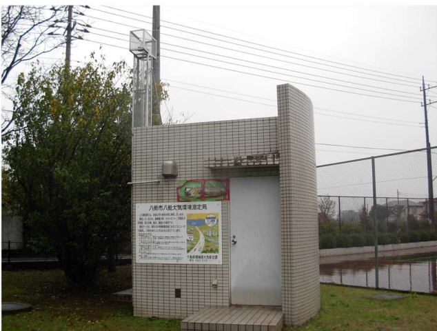
大気環境常時監視測定局(八街市八街局)