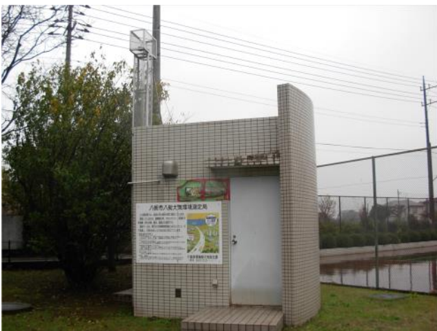
大気環境常時監視測定局(八街市八街局)