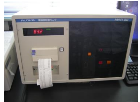
写真7-1 モニタリングポスト計測部