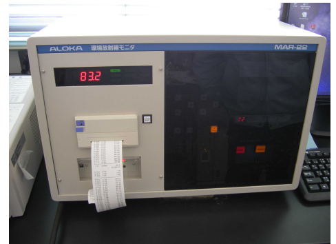
写真7-1 モニタリングポスト計測部