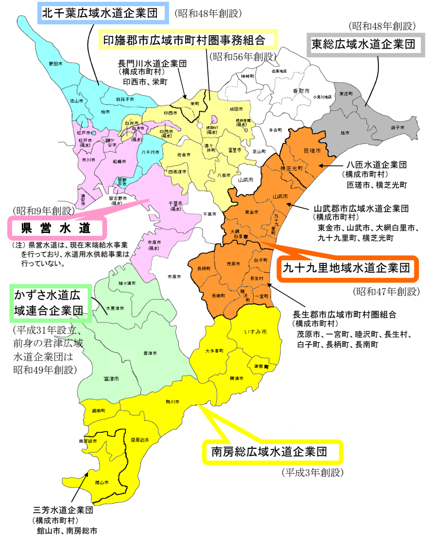
県内6用水供給事業者(令和2年度決算値)