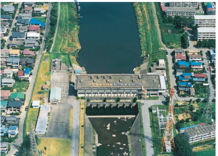
▲大和田機場(機場より上流 新川・下流 花見川)