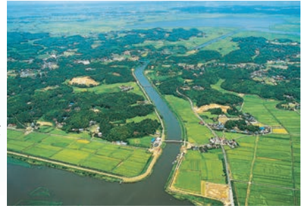
▲西・北部調整池を結ぶ印旛捷水路