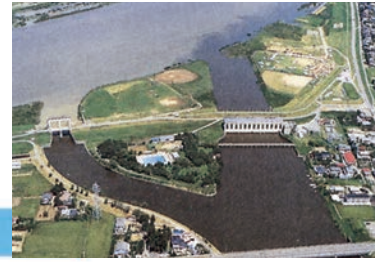
▲印旛機場(右側)及び印旛水門(左側)、上方が利根川、下方が長門川