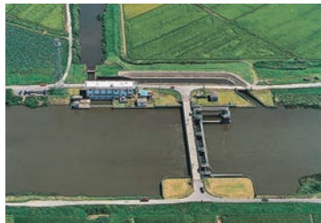
▲長門川に築造された酒直水門及び酒直揚水機場