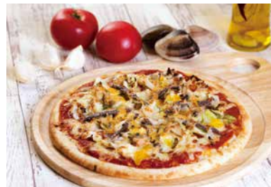
▲ALBA99 九十九里はまぐりとアンチョビのピザ