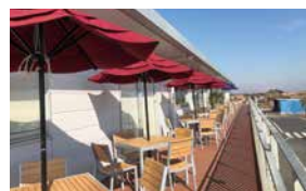
▲海の駅九十九里のテラス風景

心地よい海風を感じながらお食事が楽しめるテラス席では、ペットと一緒に食事できるスペースもございます。