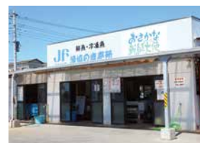
▲朝獲れだから売り切れ御免！