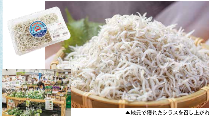
▲地元で獲れたシラスを召し上げ