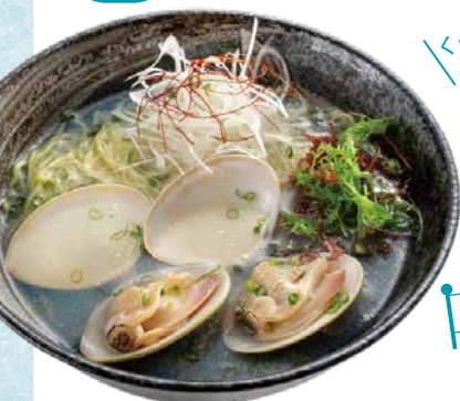
▲葉武里 はまぐりラーメン