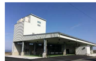
竹岡市場荷捌き施設 (令和3年供用開始)