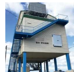
船橋港製氷貯氷施設