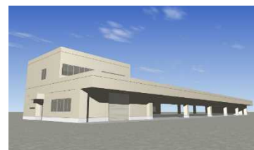
船形市場荷捌き施設 (完成予想図)