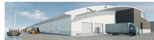
高度衛生管理型市場 (銚子第3市場完成予想図)