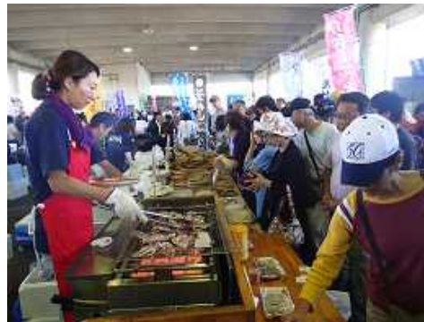
図4 朝市の様子、 多くの人で賑わっています

開催当初は「たこ飯」の味を知っている身内からの注文が多かったですが、回を重ねる毎に口コミで評判となり、朝市の開催時刻である8時前から行列ができ、開場から30分程度で売り切れるまでになりました。予想外に需要が多いことが分かった中で、人員にはある程度の余裕があるものの、機材の不足により供給が間に合っていなかったことから、平成26年5月にガス炊飯器を一つ増やして製造体制の拡充を図り、現在は1回当たり約11釜分(300食前後)を販売しています。しかし、それでも売れ