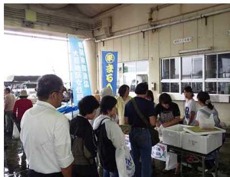
図5 たこ飯販売コーナー