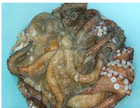
図2 大原で水揚げされたマダコ

そしてこれらのマダコは産卵期直前である冬季に北から南に向けて沿岸域を移動してくる群を漁獲していることから、サイズが大きく味わい深い旨みがあるのが特徴で、プロの料理人からは「明石タコ」と並び日本の二大タコと