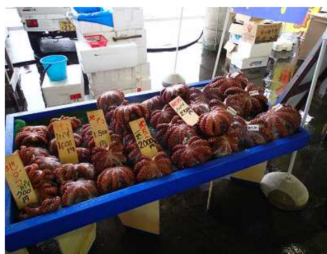
図7 マダコの販売コーナー (他にもマダコ関連商品が数多く扱われています)

また、現在「港の朝市」ではマダコを扱う店も多く、ゆでだこの販売のほか、「たこ入り焼きそば」や「たこ入り卵焼き」、「たこ飯おにぎり」といった加工品まで、数多くの品目がそろえられています（図7）。実際に「たこ飯」を購入された方に話を聞いたところ、「会場の至る所でマダコに関連する商品が並んでいるのを見て、大原でマダコが多く水揚げされていることを初めて知った」という方が数多くいらっしゃいました。このことから、女性部だけでなく朝市全体でマダコに関連商品を取り扱うことで、より効率的にPRできていることが実感できました。