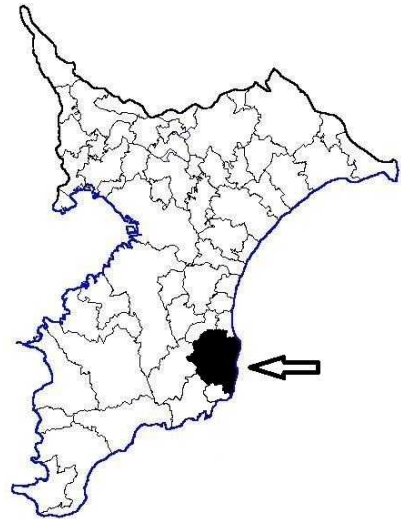
図1 いすみ市の位置

また、いすみ市の沿岸域は良い漁場に恵まれ、私たちが所属する夷隅東部漁業協同組合では、小型漁船による様々な漁業が営まれています。特に、大原沖には「器械根」と呼ばれる全国有数の広大な岩礁帯があり、多くの魚介類が生息しています。