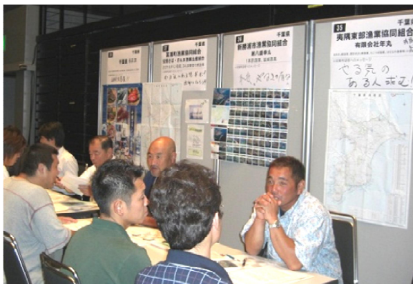
図4 出展ブースにて来場者へ説明

年丸の出展ブースは、多くの来場者が説明を聞くため、終始混雑しており、結局この日は説明を聞くことができませんでした。(図4)