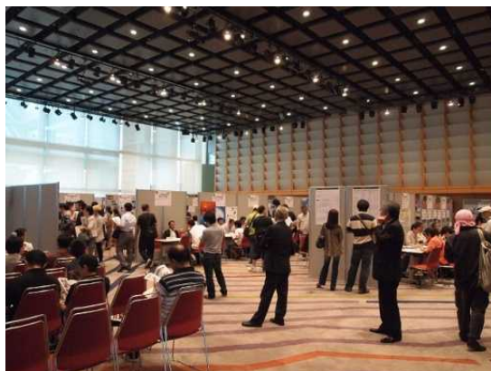
図3 漁業就業支援フェア会場の様子

特に、千葉県の出展ブースでは県の普及指導員の方から、県内漁業の状況、漁師になるための手順だけでなく、就業を支援するための様々なサポートがあることなど、詳しい説明を聞くことができました。