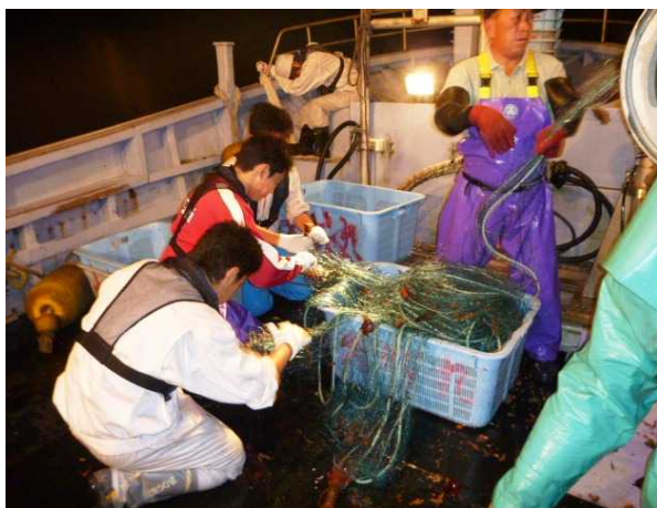
図5 揚網作業とイセエビ外し体験

水産業インターンシップは、「県水産業に関する知識の習得や、将来の担い手の育成」などを目的として、県内に在住・通学している高校生を対象に毎年行われているものであり、今回の内容は、2日間(8月3日～4日)の刺網(イセエビ)漁業の乗船実習及び陸上実習というものでした。