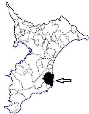
図1 いすみ市位置図

なお、漁協が取り扱うイセエビは「伊勢海美」として平成17年に商標登録され、市場に出荷するほか、漁協直売所（いさばや）でも販売されています。