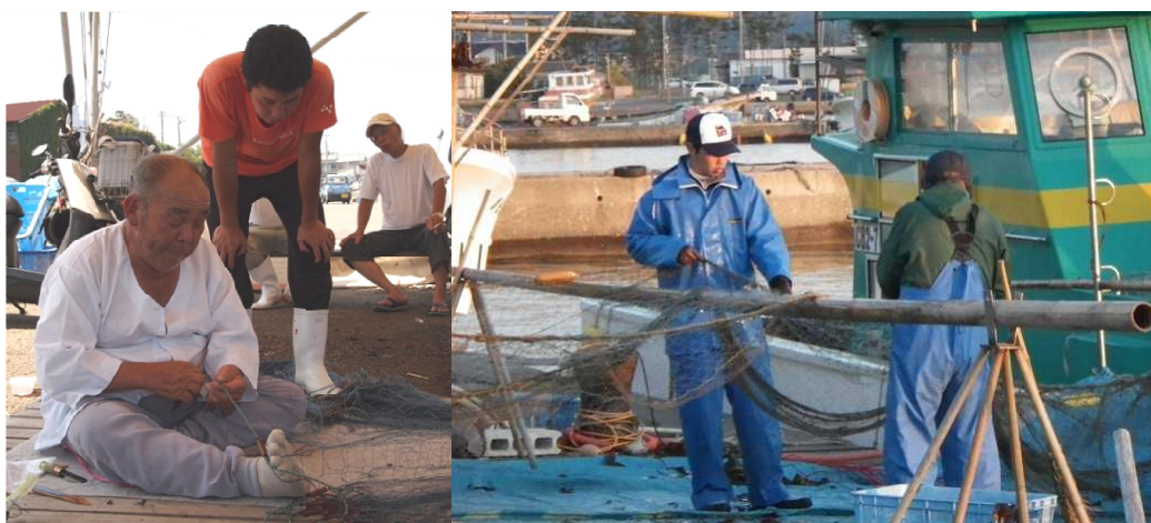
図7 陸上作業指導の様子

陸上作業指導では、魚の選別方法、漁具の製作・補修、漁船の保守・点検などを学びましたが、特に網の補修作業はとても複雑で難しく、今でも勉強の毎日です。(図7)