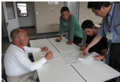
図6 漁業知識研修の様子