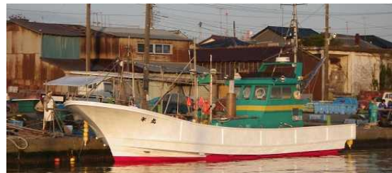
図2 会社所有の小型漁船（年丸）