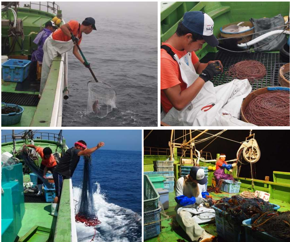
図9 操業の様子（上：マダイはえ縄漁、下：イセエビ固定式刺網漁）