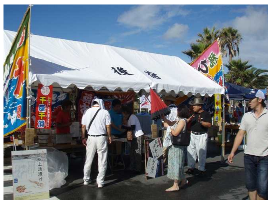
図8 おんじゅく伊勢えび祭り出店

ほとんどの客が試食後購入するというパターンであったため、私達の商品を購入してくれたものと判断した。先の商談