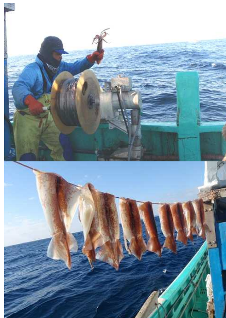
図4 沖干し作りの様子

このような状況を打開する策を岩和田青年部では常々考えていたところ、部員の中から「イカ沖干しを作り、付加価値を付け売ることによって、水揚の減少による収入減をカバーすることができる。加えて、この地域は昼イカ操業のため、夜イカ操業の地域ではあまり作れない沖干しを青年部活動で作りたい」という声が上がったため、青年部員一丸となってこれに取り組むこととした。