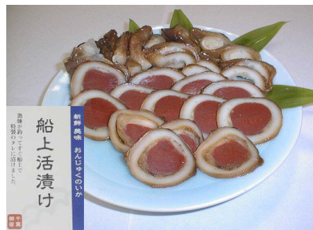
図6 沖漬け（商品名：船上活漬け）

組合では、「平成22年度ちば農商工連携事業」の助成を受け、沖干しと併せて沖漬けの商品開発にも取り組むこととした。