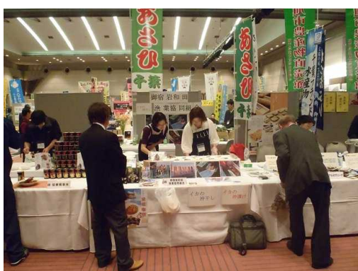
図7 ちば大地と海の恵み商談会展

完成した商品をもって組合は、販路開拓のため商談会「ちば大地と海の恵み商談会」(平成23年1月)、「FOODEX JAPAN 2011」(同年3月)に臨んだ。なお、価格については