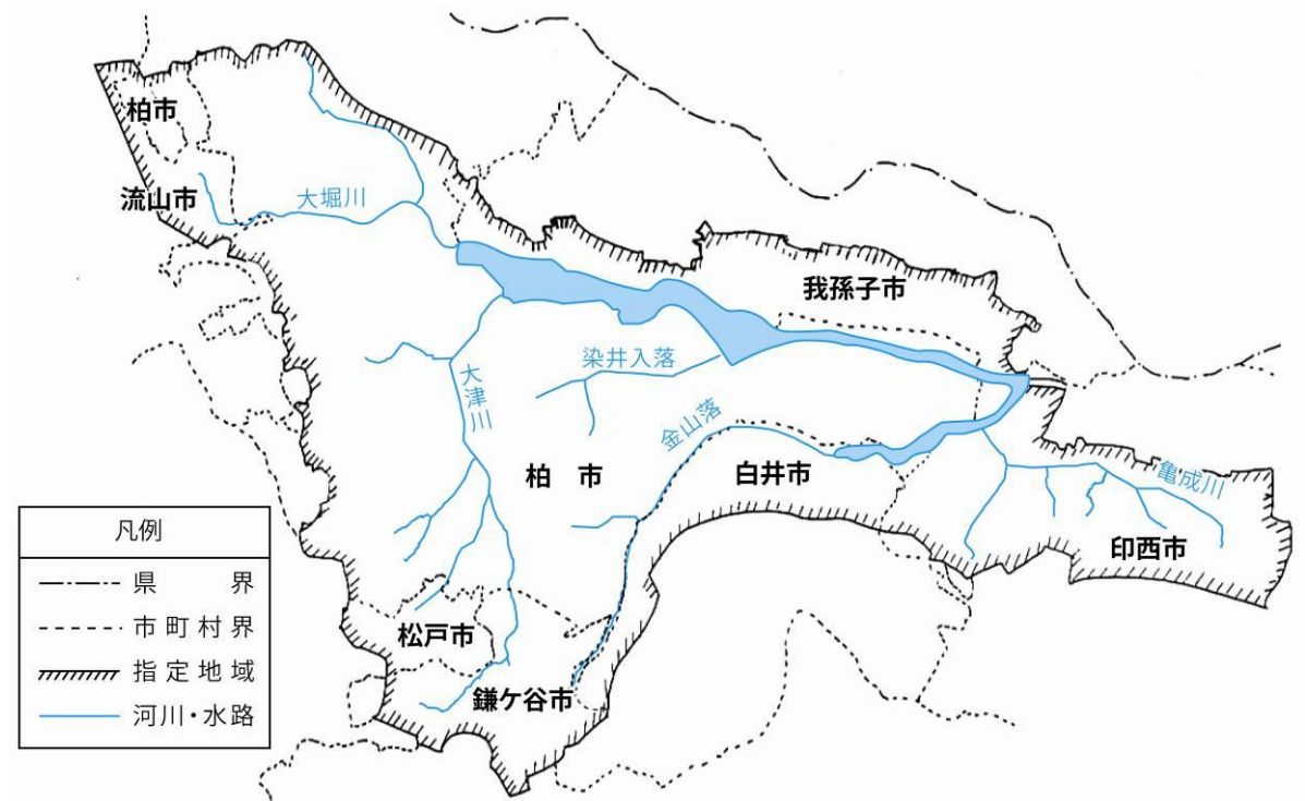
図 1 手賀沼・流域

手賀沼は千葉県北西部に位置し、その流域は7市にまたがり、流域面積は約144km 2 、約52万人が住んでいます。