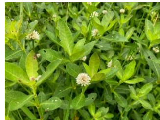
ナガエツルノゲイトウ

印旛沼及び手賀沼とその流域河川の水環境の保全を図るため、外来水生植物（特定外来生物による生態系等に係る被害の防止に関する法律第2条第1項により定められた特定外来生物のうち植物界に区分されるナガエツルノゲイトウ又はオオバナミズキンバイ等）を駆除する活動に要する経費を県が補助します。