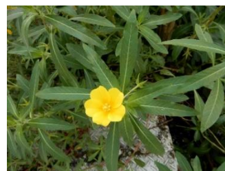
オオバナミズキンバイ

外来水生植物の防除について、当該事業実施後も継続的に活動を行う市民団体で、規約を有し、団体の意思を決定し執行する組織が確立されていること等の要件を満たすもの。