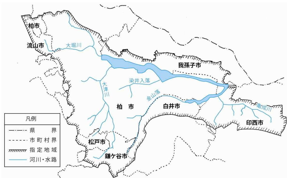
図 1 手賀沼・流域

手賀沼は千葉県北西部に位置し、その流域は7市にまたがり、流域面積は約144km 2 、約52万人が住んでいます。