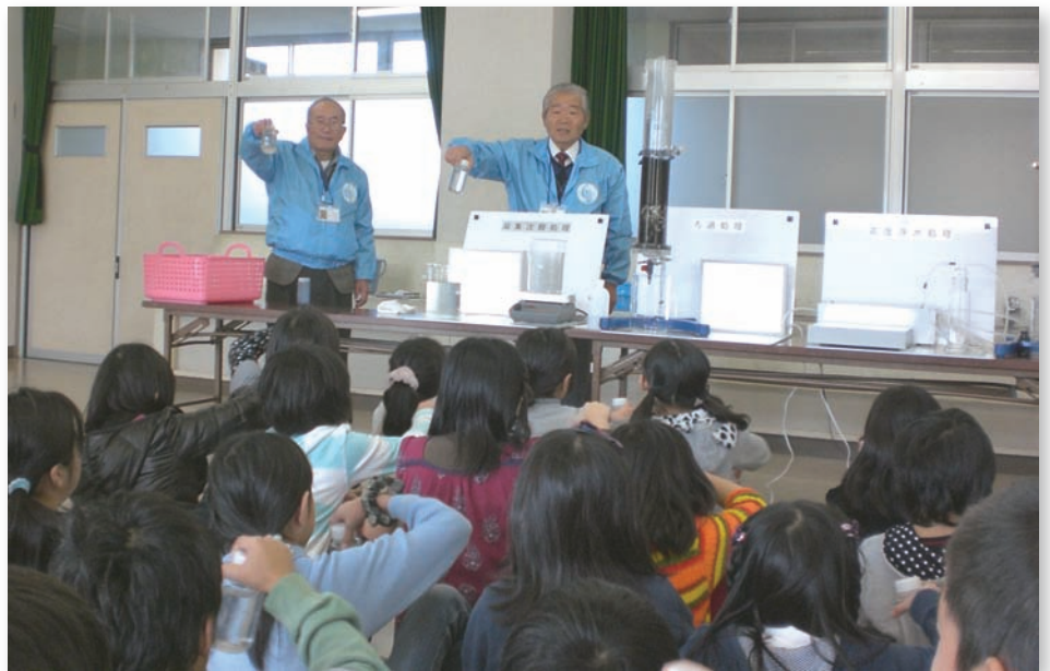
川や沼の水から水道水ができるまでの実験を体験していただいているところです。