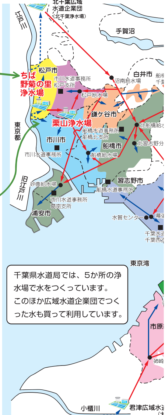
浄水場別施設能力