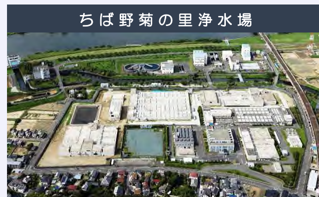
ちば野菊の里浄水場

千葉市花見川区柏井町430 敷地面積 258,603㎡ 給水区域 浦安市の全域と千葉市・市原市・船橋市・市川市・習志野市の一部 取水場所 東側施設：利根川水系印旛沼 西側施設：利根川 給水能力 東側施設：170,000㎡/日 西側施設：360,000㎡/日 給水開始 昭和43年7月