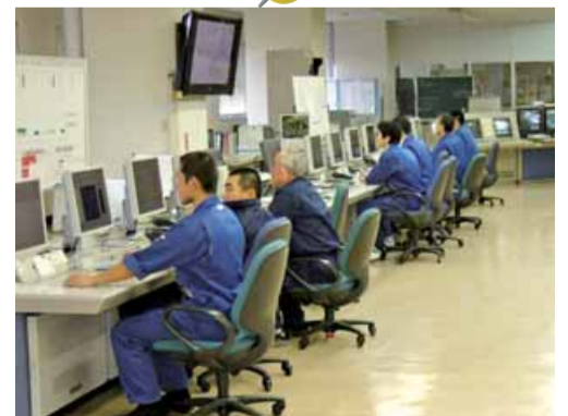
浄水場監視制御設備の更新 老朽化した浄・給水場の設備の更新により、水道水の安定的な供給に努めます。