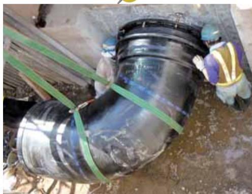
管路の工事 計画的な管路の更新・整備により、耐震化を進めています。