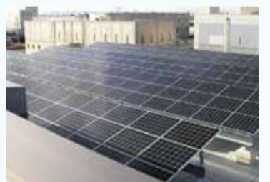
太陽光パネルの設置(ちば野菊の里浄水場)