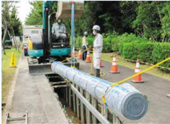
水道管の取替工事