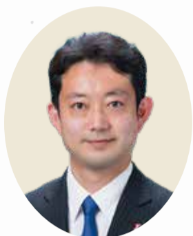
千葉県知事 熊谷 俊人