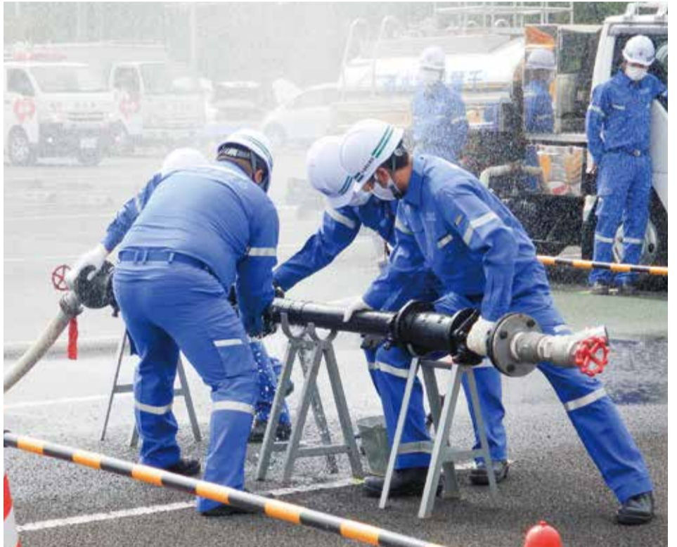
▲九都県市合同防災訓練(千葉市会場)

さらに、九都県市合同防災訓練における応急復旧訓練や、首都直下地震を想定した全局的な総合訓練、各所属で初動体制に重点をおいた訓練を実施し、災害時や事故時における即応体制を強化しています。