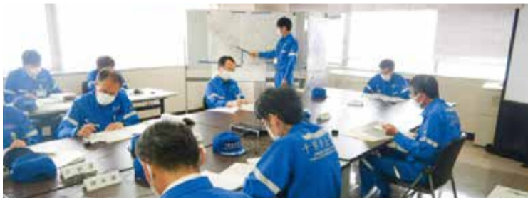
◀オリンピック・パラリンピック開催時の事故を想定した訓練