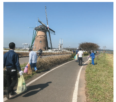
当局職員による清掃活動

同協議会ではこの他にもみなさまにご参加いただけるイベントをご用意しておりますので、水源保全のためにも是非ご参加ください。