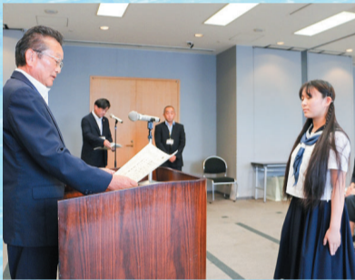
副知事からの表彰の様子

※詳しくは千葉県水 政課ホームページを ご覧ください。過去の 内容や参考文献など の参考資料となる 「水のはなし」など も掲載しています。