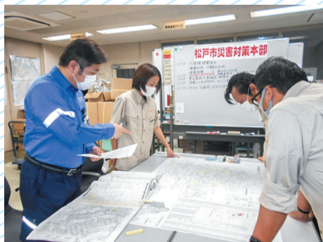
風水害に備えた給水区域11市との合同訓練 (松戸市)

さらに、首都直下地震を想定した全局的な総合訓練や、各所属で初動体制に重点をおいた訓練を実施し、災害時や事故時における即応体制を強化しています。