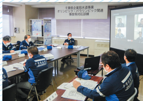
オリンピック・パラリンピック開催時の事故を想定した訓練