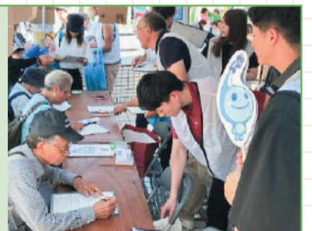
イベント対応の様子

主な事業としては、ちば野菊の里浄水場(第2期)の施設整備、水道施設の耐震化、上下水道料金の徴収一元化などに取り組んでまいりました。ちば野菊の里浄水場の施設整備は、令和5年度の稼働を目指しています。水道施設の耐震化は湾岸埋立地域の管路を優先して実施しており、災害に備えるため今後も引き続き取り組んでまいります。また、令和3年1月から上下水道料金徴収一元化の対象市域を拡大するなど、今後もお客様のニーズを捉えた事業運営に取り組んでまいります。