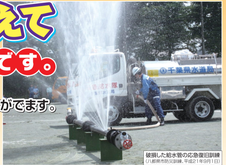
破損した給水管の応急復旧訓練 (八都県市防災訓練、平成21年9月1日)

災害はいつ起こるかわかりません。 災害により水が使えなくなると、日常生活に大きな支障がでます。 日ごろから、ご家庭でも水を備えておきましょう。