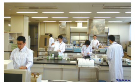
▲水道水の水質検査項目は202項目に及び、厳しい検査を経た安全な水道水をお客様にお届けしています。