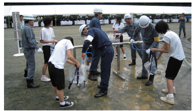
第29回八都県市合同防災訓練(千葉市会場訓練)の様子(平成20年9月)

防災意識の高揚と、防災行動力の向上を目的に、定期的に各種訓練を実施しています。また、八都県市合同防災訓練などの合同訓練に参加しています。