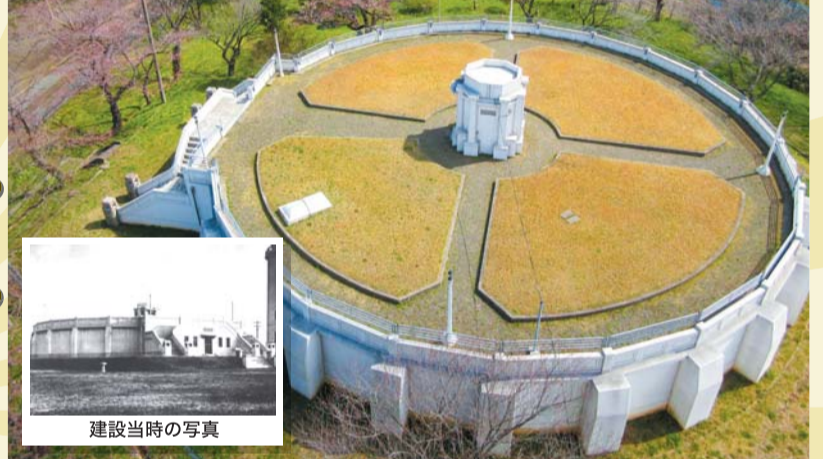
千葉分場1号配水池(千葉市)

▶特徴:大きな円形の構造で、幾何学模様を組み合わせたアールデコ調の階段や中央塔で飾られている。 ▶鉄筋コンクリート造、梁・柱式円形水槽(半地下式) ▶内径:29.0m ▶有効水深:4.3m ▶有効容量:2,770m 3 ▶竣工:昭和12年 ●土木学会選奨土木遺産認定(平成22年度) ●登録有形文化財登録(平成29年度)