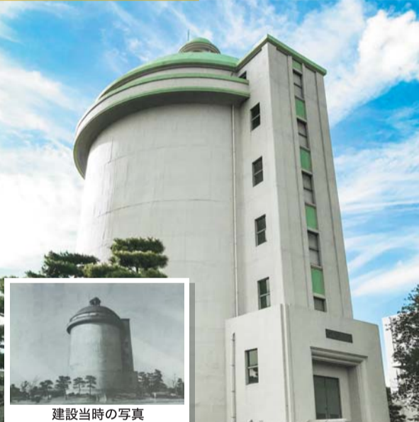
栗山配水塔(松戸市)