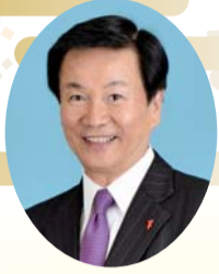
千葉県知事 森田 健作

千葉県水道局では、皆様に「くらし満足度日本一」を感じていただけるよう、本年も安心・安全な水道水の供給、そして、県内企業の血液とも言える工業用水の安定供給に取り組んでまいりますので、御理解と御協力を賜りますようお願い申し上げます。