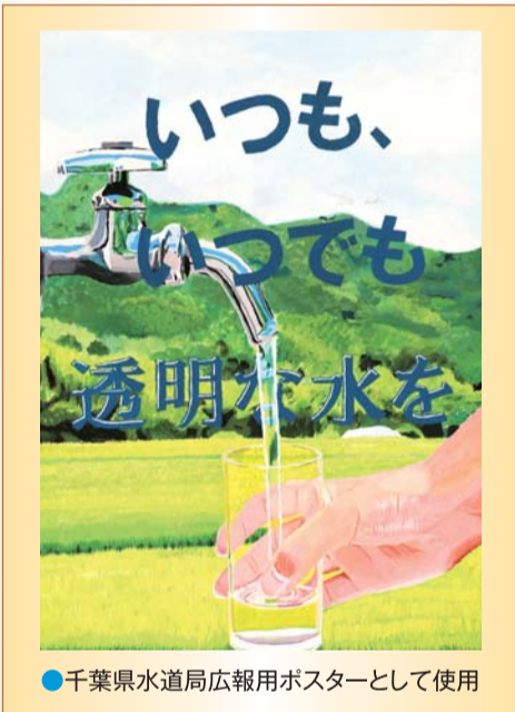
●千葉県水道局広報用ポスターとして使用