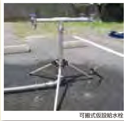
可搬式仮設給水栓