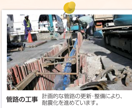
管路の工事 計画的な管路の更新・整備により、耐震化を進めています。