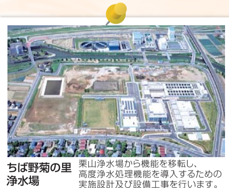
ちば野菊の里 栗山浄水場から機能を移転し、高度浄水処理機能を導入するための実施設計及び設備工事を行います。