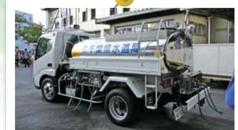
給水車 震災や取水制限の教訓を踏まえ、 給水車の増車等の応急給水体制強化を目指します。