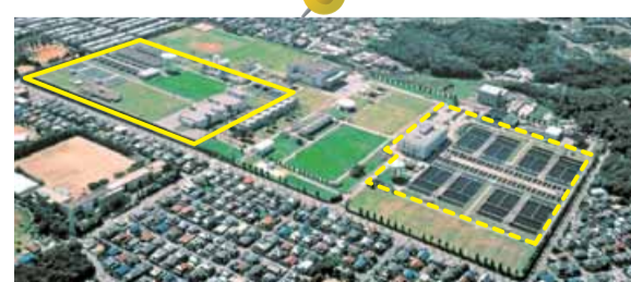
柏井浄水場 全国に先駆けて高度浄水処理システムを導入した 東側施設(実線内)と導入が進められている西側施設(点線内)