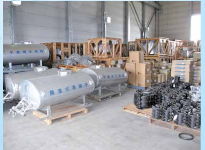
資材倉庫内部の様子 ※左：応急給水用タンク 右手前：漏水修繕用材料