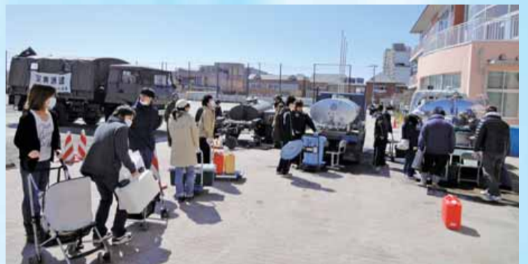
東日本大震災後の応急給水の様子(浦安市)