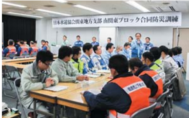
各事業者との合同訓練(日水協合同防災訓練)