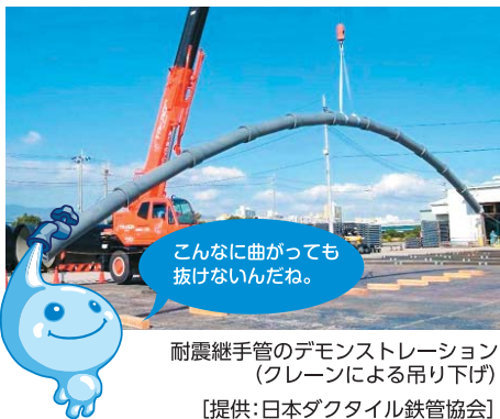
耐震継手管のデモンストレーション(クレーンによる吊り下げ)

県営水道の給水区域には約9,140kmの水道管が埋まっており、このうち約2,060kmは耐震化を完了しています。今後も、地震に強い水道に向けて耐震化を進めていきます。