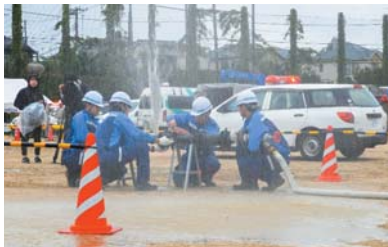
ライフライン復旧訓練の様子(九都県市合同防災訓練)

今年度は、8～9月に開催されている九都県市 ※ 主催の合同防災訓練に参加し、ライフライン復旧訓練等を行っています。また、県外の水道事業者と連携した訓練にも参加しており、11月には、甲府市で開催される(公社)日本水道協会 関東地方支部南関東ブロック主催の合同防災訓練への参加を予定しています。