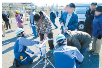
断水時の応急給水訓練には住民の方にも参加いただきました