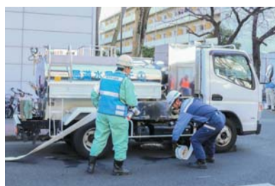
覚書を締結した神戸市水道局も訓練に参加（東京都立広尾病院への応援）