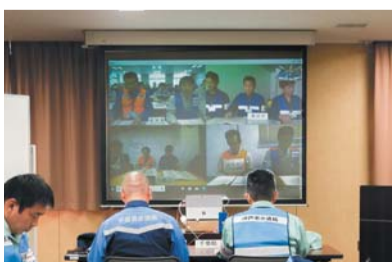
被災した5会場を結んだテレビ会議は初の実試