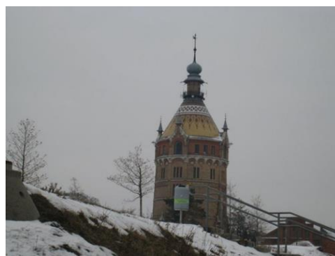
図 3 ファヴォリテン給水塔