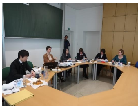
図 2 ウィーン市水道局での研修