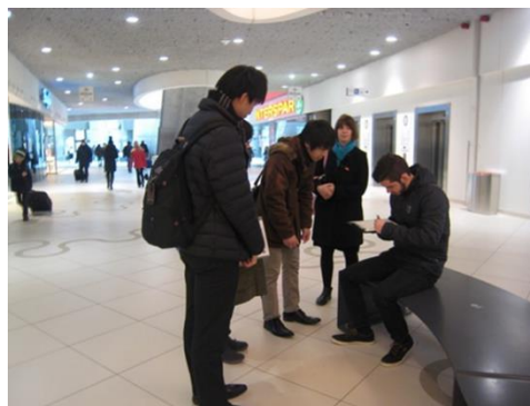
図4 アンケート調査の様子

オーストリアにおける水道水の評価は極めて高く、その背景には、恵まれた水源や徹底した水源環境保全の取組などがあるが、広報活動による貢献も大きいと考えられる。湧水を水源としているなど当局との違いはあるものの、当局で行っている小学生を対象とした広報活動や、水道施設を活かした広報活動など、参考にできる点も多いと思われた。